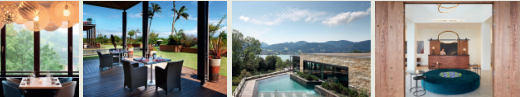
Von links: die Alpenbrasserie im Das Tegernsee; Terrasse im Conrad Pezula; Außenpool im Das Tegernsee; der Empfang im Eagles Villas; eine der

Begleiten Sie uns in luxuriöse Hotels und Resorts in Griechenland und Südafrika sowie