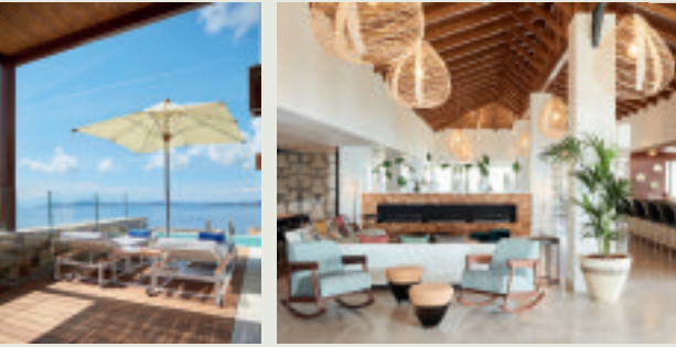
privaten Terrassen mit Pool und die stylische Lounge