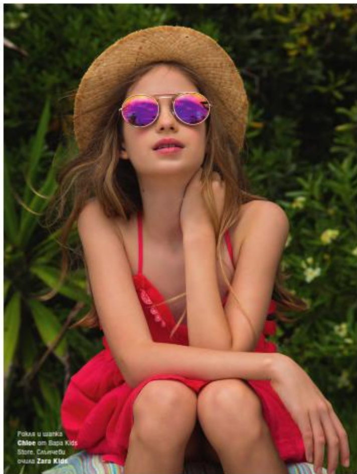
Рокля и шапка Chloe от Bara Kids Шарф, Слънчев очила Zara Kids

М ного по-добре е да взимаме неща в един стил и в един цветен спектър. Например, момчетата: единият може да сложи класически светлокафяв панталон, другия - маслинен карго панталон с джобове, а третия - дънки или бежови панталони. Отгоре както дънкови ризи, така и маслинен или бордо цветовете и жилетка. Един алтернативен вариант - карирана риза, може да се носи разкопчана с бяла тениска или по-официално – напълно закопчана. Чудесен избор са уютни сиви суитшърти със или без надписи.